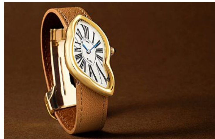
Cette Cartier Crash, London, de 1987, sera mise aux enchères à Hong Kong le 24 avril. Estimation: de 400'000 à 800'000 dollars. Sotheby's