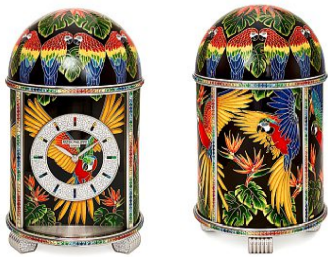
Pendulette Dôme «Aras» sertie en émail cloisonné rehaussé de peinture miniature sur émail. Mouvement mécanique. Patek Philippe

Soixante-cinq nouveaux garde-temps y sont dévoilés, dont