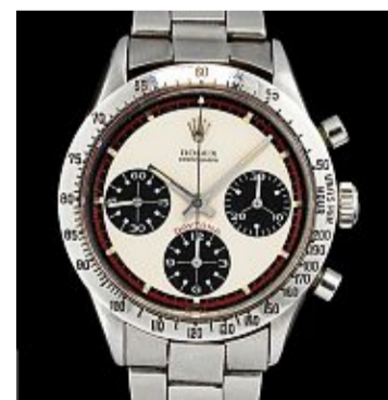
Rolex Daytona Paul Newman, réf. 6239, vers 1970. Estimation: entre 80'000 et 100'000 francs.

Au programme également, deux très belles huiles sur toile du grand maître suisse Max Bill. Notons qu'elles sont issues de la même série mais qu'elles proviennent de collections différentes. Ici, formes géométriques et concepts mathématiques sont